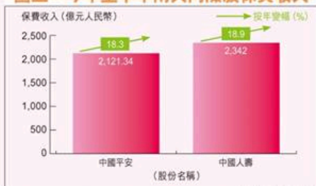
圖五：今年上半年兩大內險股保費收入