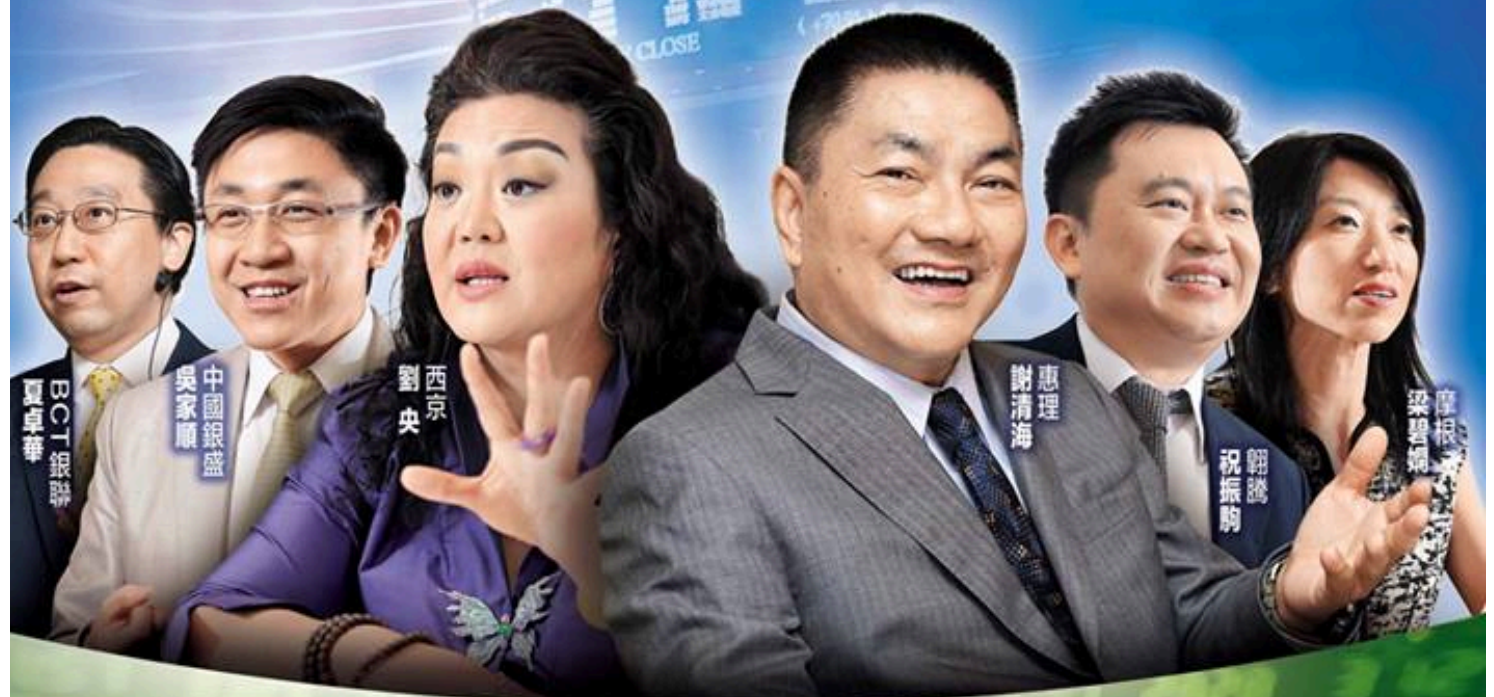
區卓華 BCT 證券