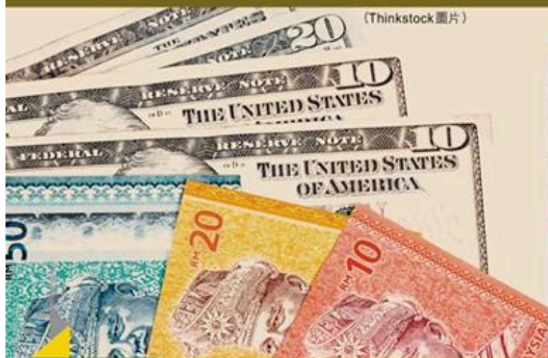
圖一：美息上升亞幣調整