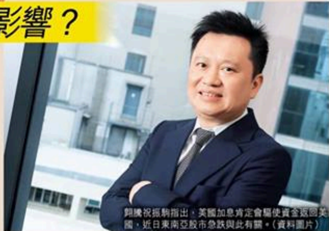
翹騰祝振駒指出，美國加息肯定會驅使資金返回美國，近日東南亞股市急跌與此有關。